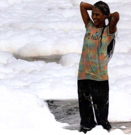
«Mamma Yamuna» di Vito Robbiani.

Concretamente come avviene la selezione delle pellicole? «Su una piattaforma mondiale di cinema annunciamo il nostro festival e il relativo tema. E poi attendiamo gli interessati a partecipare. Quest'anno abbiamo dovuto scegliere tra oltre duecento titoli, la maggior parte davvero notevoli». Sono suddivisi in sei concorsi: cortometraggi svizzeri, corti internazionali, lungometraggi, animazione, video musicali, VideoArt Contest.