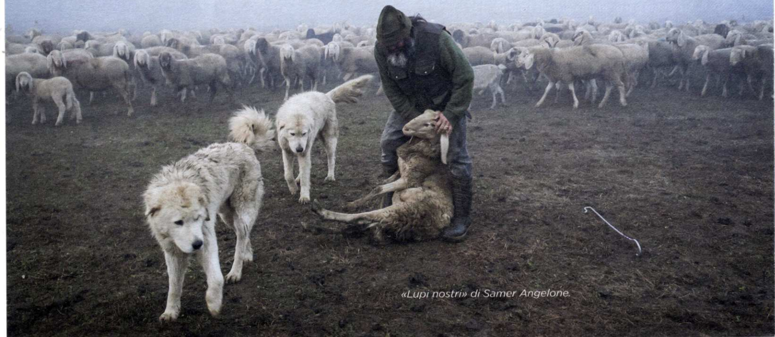
«Lupi nostri» di Samer Angelone.

Drago Stevanovic: «Intendiamo tematizzare alcuni dei cambiamenti che stanno caratterizzando la nostra attualità: clima, territorio, diversità, identità, integrazione, sensibilità verso i deboli e i meno visibili».